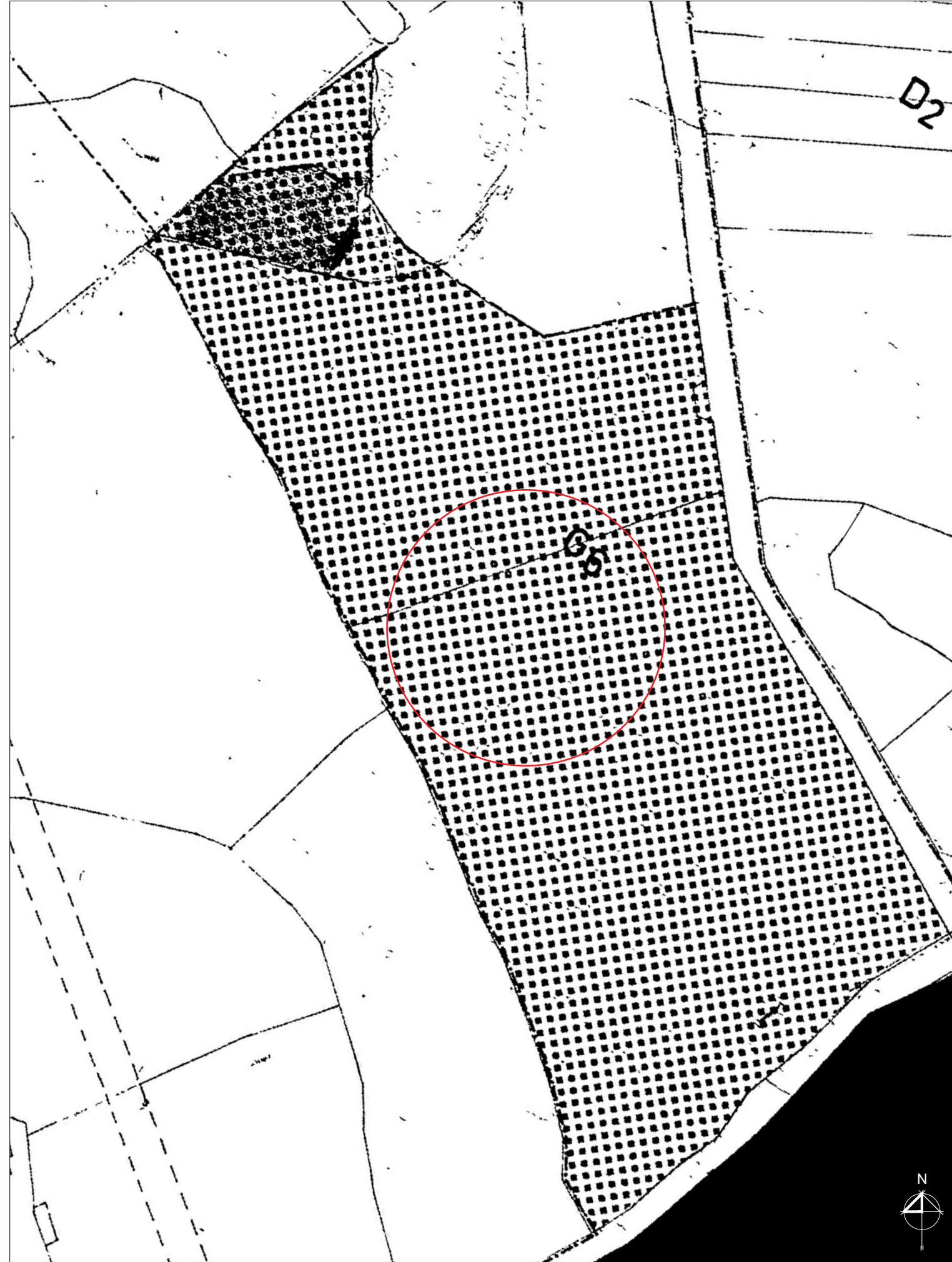
STRALCIO Pdf - scala 1:2.000